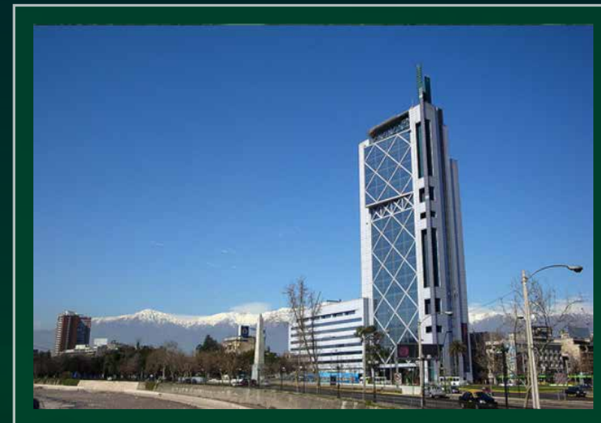
Abril 11-12-13 de 2018, Edificio Telefónica Av. Providencia 111, piso 1, Providencia.

El Primer Congreso Latinoamericano de Agricultura de Precisión, CLAP 2018 , es una gran oportunidad para establecer vínculos con especialistas, usuarios y empresas de Agricultura de Precisión, permitiendo a los participantes generar redes de contacto técnicas y comerciales.